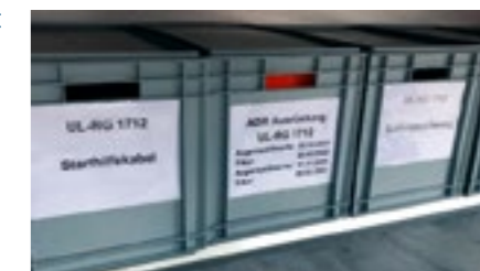
Bis ins Detail organisiert und strukturiert (Blick in einen Teva LKW Staukasten)